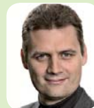
Ulf Munkedal Fort Consult